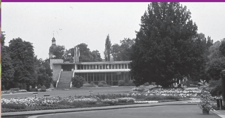
Foto klein: zur Verfügung gestellt von Karl-Ulrich Pachale, Coburg. Herzlichen Dank. Foto groß: Quelle: Stadtarchiv Coburg; Fo.04.01 R 00028.

Oberbürgermeister Langer weiht das Kongresshaus ein