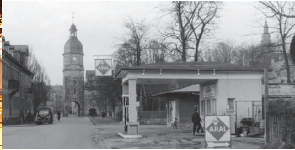
Die BV-Aral AG musste mit ihrer Tankstelle an der Ketschendorfer Straße wegen der Errichtung des Kongresshauses Rosengarten weichen. Foto um 1953.

Ein Ort für Kongresse und Messen, egal ob indoor oder im wunderschönen Rosengarten.